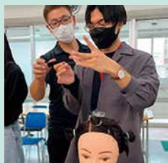
ワインディング体験