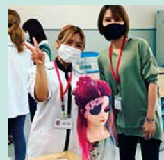
ヘアアレンジ体験